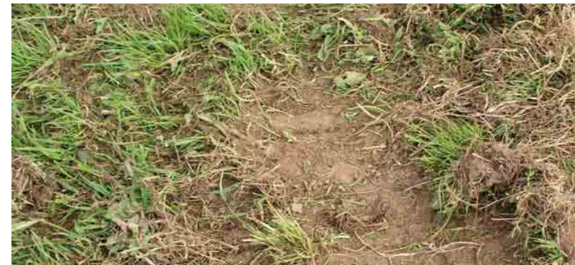
Bestandslücken nach trockenen Jahren.