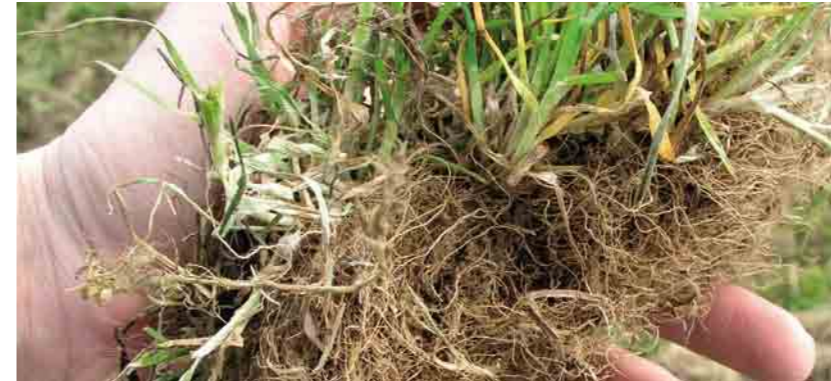
... und Gemeine Rispe